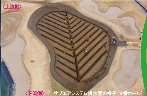
サブエアシステム排水管の様子(9番ホール)