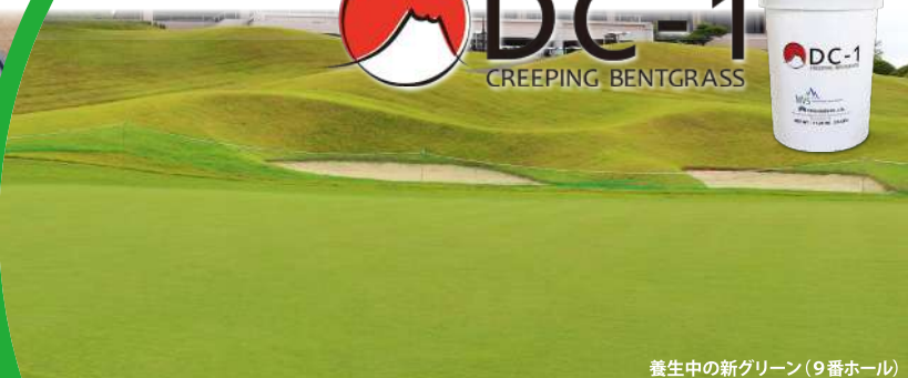
養生中の新グリーン(9番ホール)